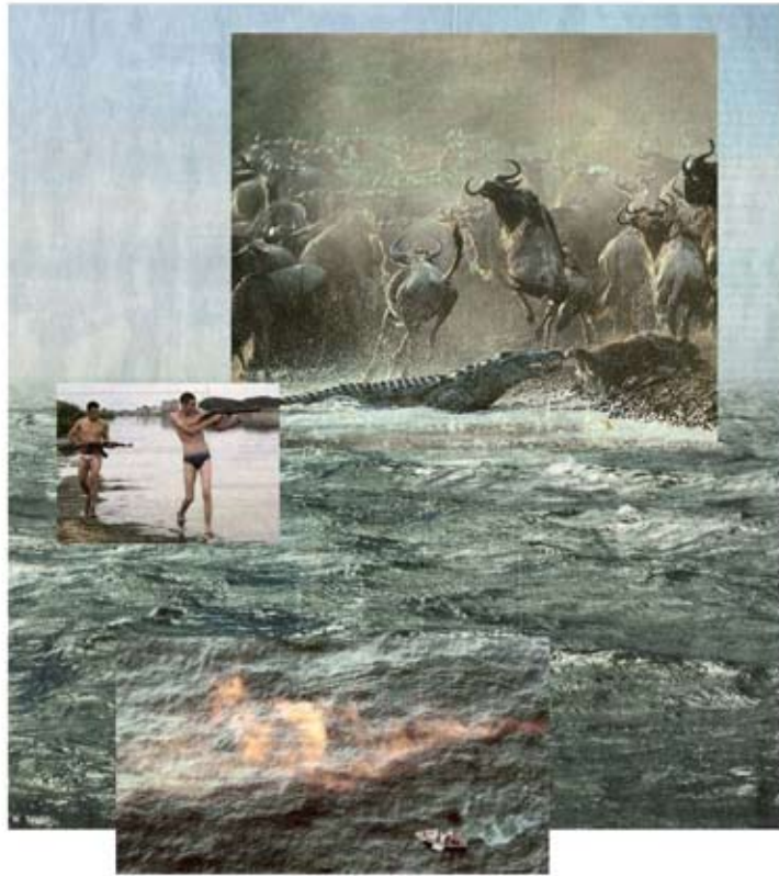
> ufer < aus der Serie Auf anmutige Art eine Bestie zu bändigen 2011 | Pigmentdrucke auf Fine-Art-Papier | 100 x 100 cm | Auflage 4 + 2 AP