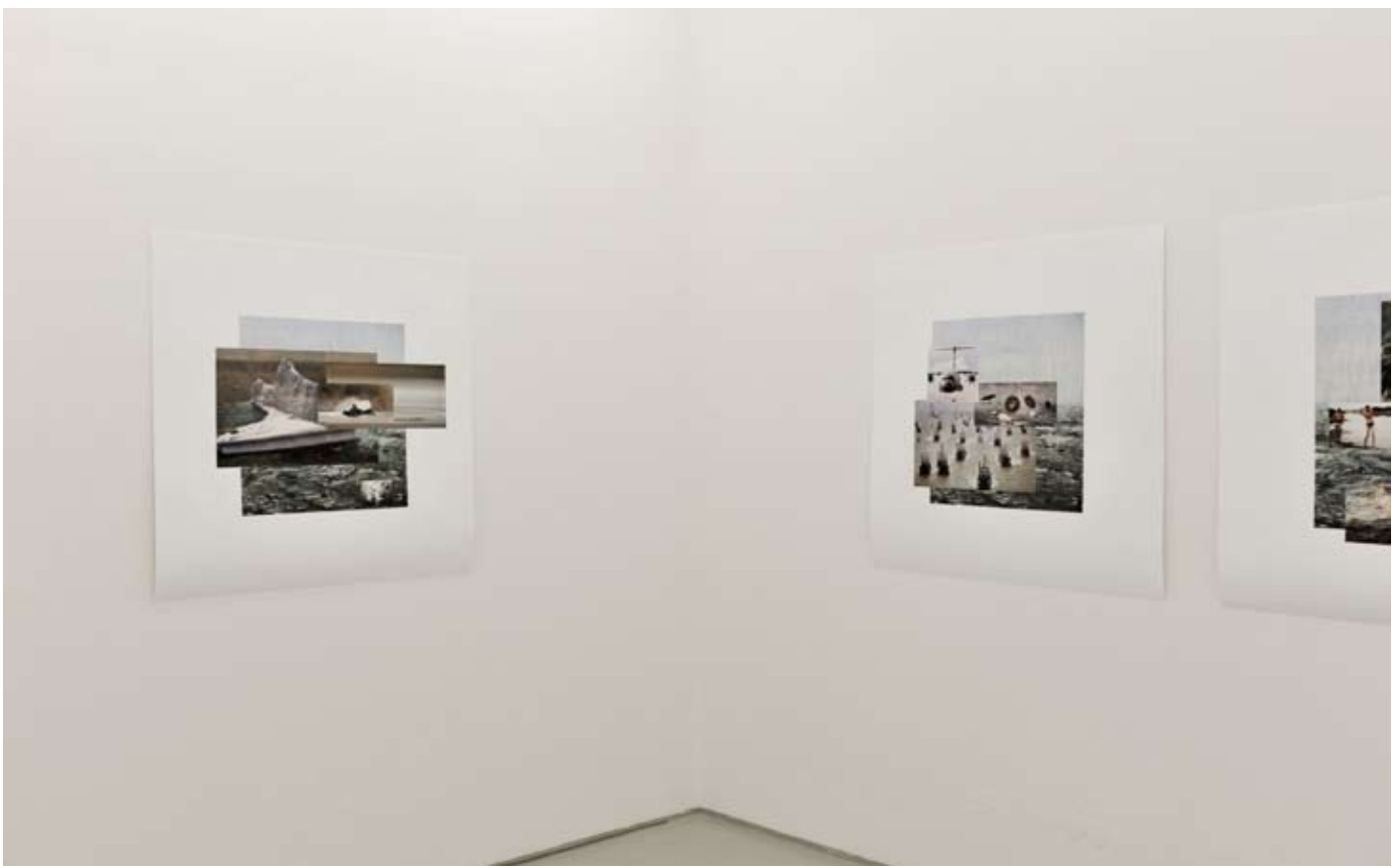
Installationsansichten Auf anmutige Art eine Bestie zu bändigen 2011 | Loris - Galerie für zeitgenössische Kunst