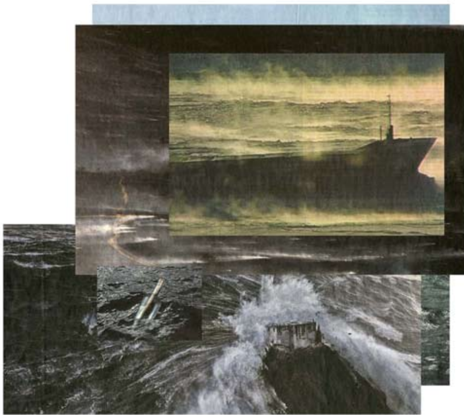
> riff < aus der Serie Auf anmutige Art eine Bestie zu bändigen 2011 | Pigmentdrucke auf Fine-Art-Papier | 100 x 100 cm | Auflage 4 + 2 AP