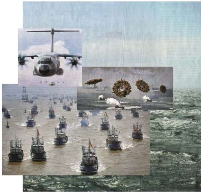
> regatta < aus der Serie Auf anmutige Art eine Bestie zu bändigen 2011 | Pigmentdrucke auf Fine-Art-Papier | 100 x 100 cm | Auflage 4 + 2 AP