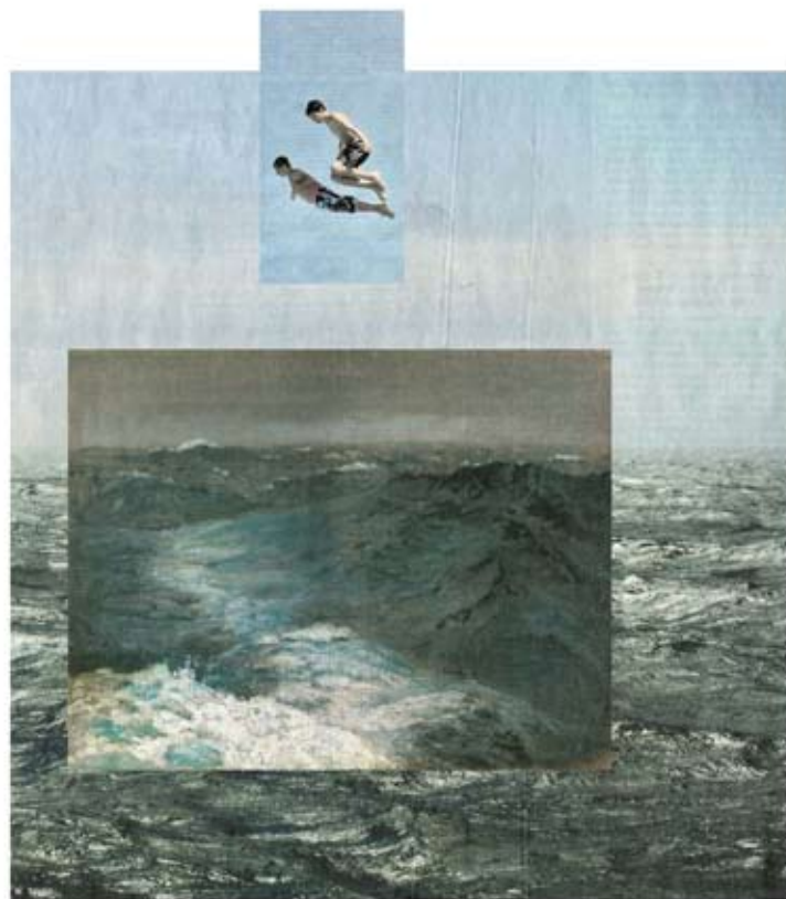
> klippe < aus der Serie Auf anmutige Art eine Bestie zu bändigen 2011 | Pigmentdrucke auf Fine-Art-Papier | 100 x 100 cm | Auflage 4 + 2 AP