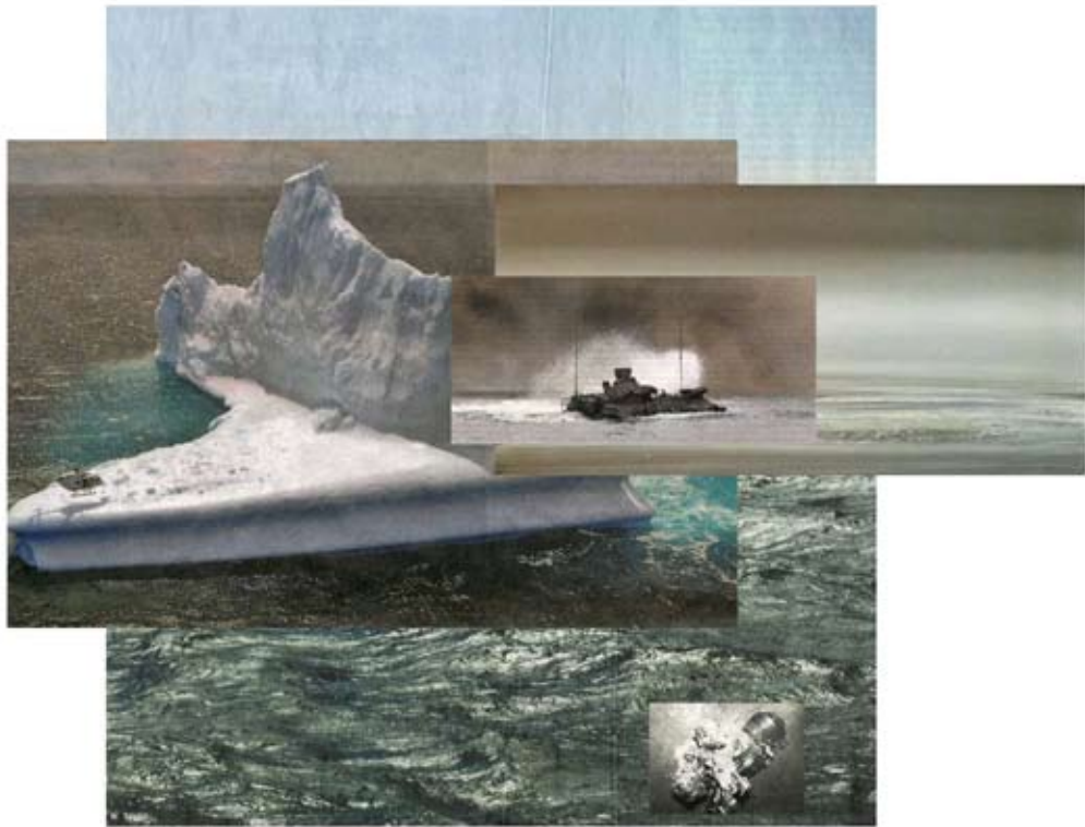
> untiefe < aus der Serie Auf anmutige Art eine Bestie zu bändigen 2011 | Pigmentdrucke auf Fine-Art-Papier | 100 x 100 cm | Auflage 4 + 2 AP