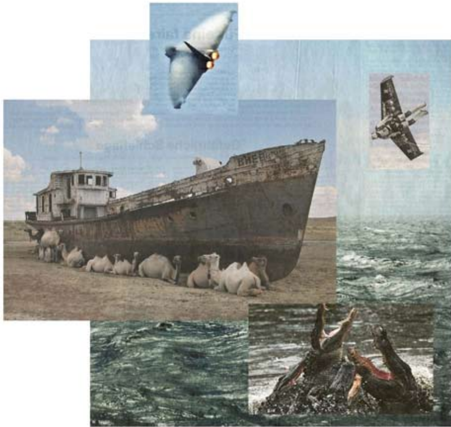
> hafen < aus der Serie Auf anmutige Art eine Bestie zu bändigen 2011 | Pigmentdrucke auf Fine-Art-Papier | 100 x 100 cm | Auflage 4 + 2 AP